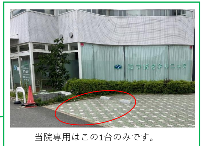
当院専用はこの1台のみです。

専用駐車場が満車の場合、こちらのコインパーキング（ヤマネエンパーキング）をご利用ください。